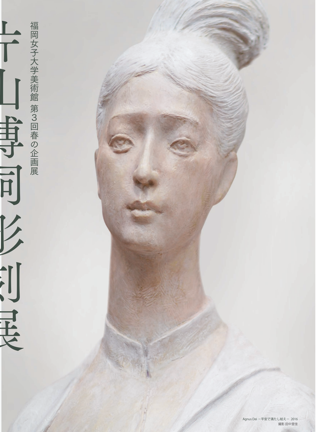
Agnus Dei - 平安で満たし給え - 2016

2019.4.1 [Mon] - 6.8 [Sat] 入場無料 福岡市東区香住ヶ丘1-1-1 福岡女子大学図書館棟内